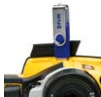
Copy to USB