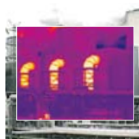
Auflösung 180 x 180 Pixel