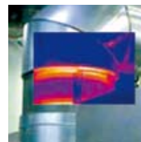
Fusion (skalierbares BiB)